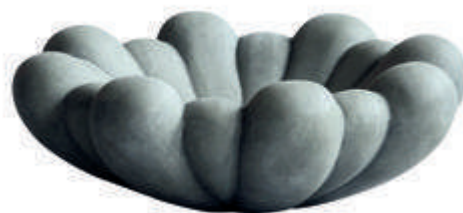
Plat Lune, en porcelaine et liseré or, Cécile Gasc , 145 €. Bougeoir Wavy Bliss, en métal laqué, Atmosfera , 3,99 €. Plateau-coupe Bloom, en céramique, 101 Copenhagen , 99 €.