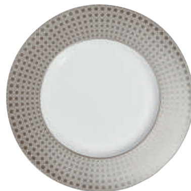
Théière collection Écume Platine, en porcelaine, Bernardaud , 840 €. Carafe-décanteur Tank, en verre noir, Tom Dixon , 144 €. Assiette de présentation collection Cannage Montaigne, en porcelaine de Limoges décorée à la feuille en platine, Dior Maison , 480 €.