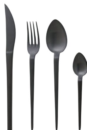
Verre Dolce Vita, en verre soufflé fait main, set de 4, Casarialto , 370 €. La Boule Set de Dîner, en porcelaine noire, 7 pièces, Villeroy & Boch , 299 €. Couverts Oslo, en inox noir, ménagère de 16 pièces, AM.PM , 129 €.