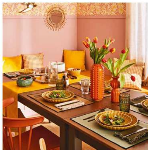
Le cottagecore, vous connaissez ? Inspiré des maisons rurales anglaises du XIX e siècle, il favorise une atmosphère rustique et éclectique en mixant des éléments vintage à des formes organiques ou des accessoires à motifs. Assiette Suny, 6,89 € pièce. Vase Picto, 17,90 €. 4Murs .