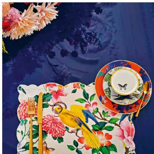
Perroquets et végétation s'invitent à table pour une immersion dans la jungle brésilienne. Le tissu en lin et coton apporte un brin d'exotisme à votre intérieur. Golden Brésil, 99 € le mètre. Clarke and Clarke .

N'oubliez pas d'ajouter une touche personnelle, cela peut être un objet de famille ou un élément fait main qui apportera de l'authenticité à votre table.