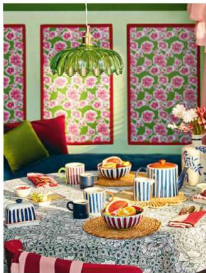
Tentez d'audacieux mélanges, notamment sur des petits éléments de décoration, comme la vaisselle. Ici, on associe les rayures avec les fleurs, pour un rendu aussi moderne que surprenant. Nappe à fleur 12 €. Beurrier en céramique rayée rouge et bleu, 4 €. Primark .