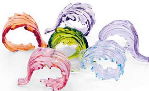
Sublimes ronds de serviette en verre de Murano, faits à la main à Venise. Leur design, en forme de feuilles, cristallise le savoir-faire des artisans italiens. 273 € le set de 6 pièces. Casariatto .

Un clin d'œil gourmand à la nature, idéal pour présenter vos plats de manière originale. En céramique, il complète parfaitement un intérieur au style rustique. Bol Choux, 9,99 € l'unité. BUT .