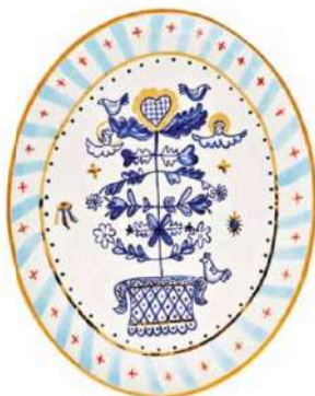
Le plat ovale est un hommage à la tradition ukrainienne et à ces symboles qui se transmettaient de génération en génération et accompagnaient les familles. Orné d'un arbre de vie doré à l'or fin peint à la main, symbole des cycles de la vie. Tree of Life, 98 €. Gunia Project .