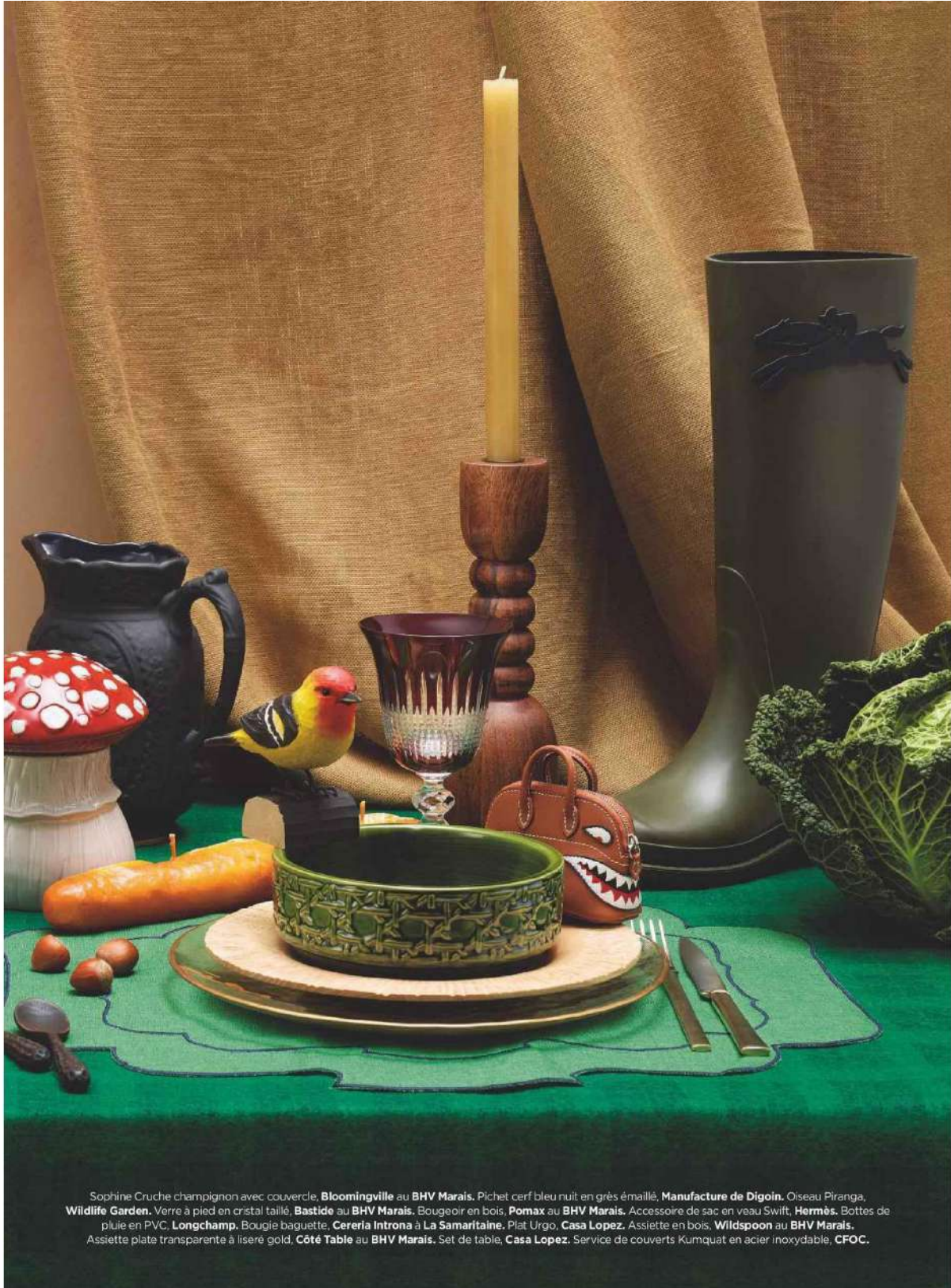
Sophie Cruche champignon avec couvercle, Bloomingville au BHV Marais . Pichet cerf bleu nuit en grès émaillé, Manufacture de Digoïn . Oiseau Piranga, Wildlife Garden . Verrre à pied en cristal taillé, Bastide au BHV Marais . Bougeoir en bois, Pomax au BHV Marais . Accessoire de sac en vaau Swift, Hermès . Bottes de pluie en PVC, Longchamp . Bougie baguette, Cereria Introna à La Samaritaine . Plat Urgo, Casa Lopez . Assiette en bois, Wildspoon au BHV Marais . Assiette plate transparente à liseré gold, Côté Table au BHV Marais . Set de table, Casa Lopez . Service de couverts Kumquat en acier inoxydable, CFOC .