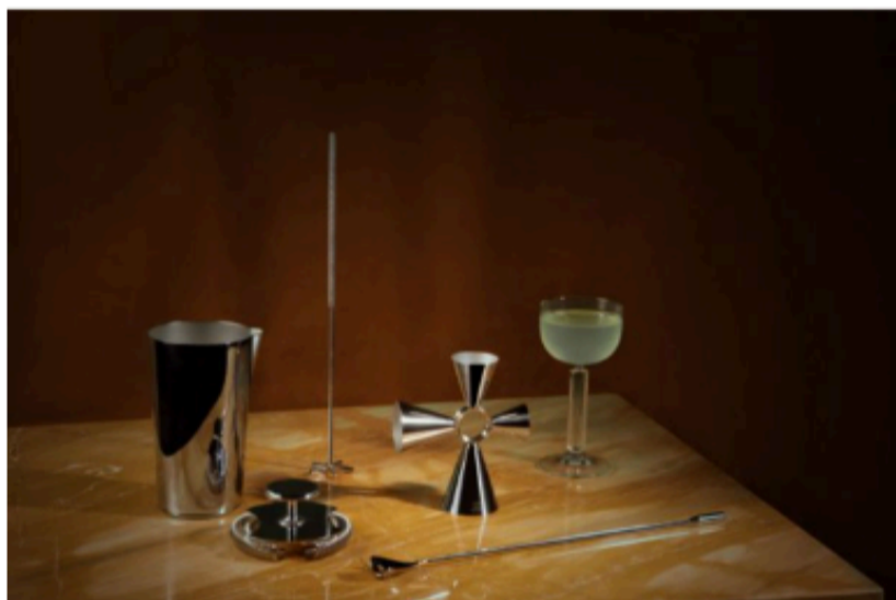
The Tending Box, design Giulio Iacchetti per Alessi.

Cosa regalare a Natale? Ecco 13 idee di design da mettere sotto l'albero. Tra novità ed edizioni speciali.